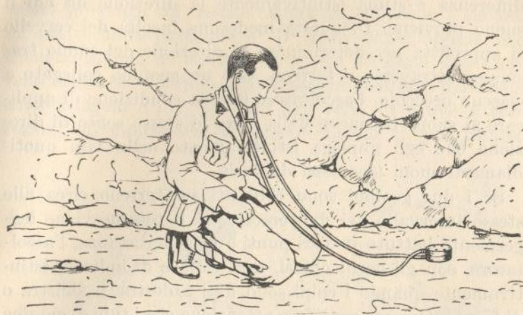
Fig. CXXXIII Impiego del geofono nell'ascoltazione semplice.

169. Determinazione della direzione del suono. — Un uomo di udito normale è capace, senza aiuto visuale, di orientarsi nella direzione dalla quale perviene il suono. Tale facoltà è dovuta al fatto che il suono prodotto a destra o a sinistra, non arriva ai due orecchi nello stesso tempo. Il cervello è capace di apprezzare questa piccola