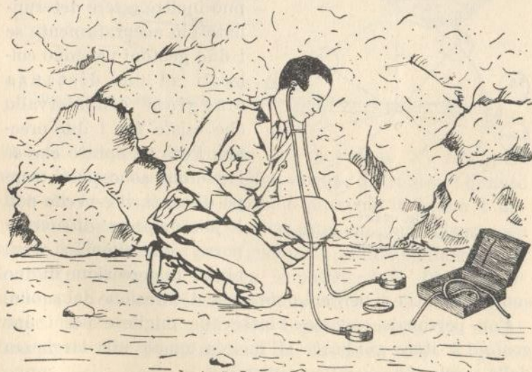
Fig. CXXXIV Impiego del geofono nell'ascoltazione direzionale.