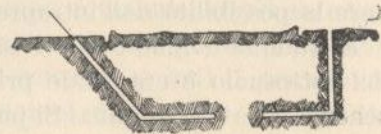
Fig. CXXVI Galleria ad infiltrazione nella guerra di mina in terreno pianeggiante.

151. Configurazione superficiale del terreno. — La topografia della località che si intraprende a minare può esercitare notevole influenza sui metodi a cui ricorrere. Se, ad esempio, le linee nemiche sono situate su posizioni meno elevate oppure a livello rispetto alle nostre, i lavori di mina possono iniziarsi scavando pozzi verticali od inclinati (fig. CXXVI) tenendo nel debito conto le difficoltà di sollevare i materiali di scavo e la possibilità di smaltire le eventuali acque sotterranee.